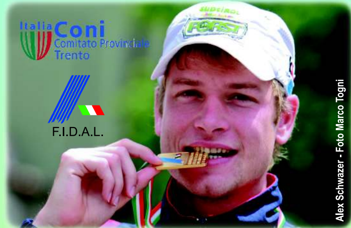
Alex Schwazer

BORG VALSUGANA Domenica 30 maggio 2010 ritrovo ore 8.00 in Piazza Degasperi ore 9.00 gara di contorno di corsa Km 3 Master F ore 9.30 gara di contorno di corsa Km 4 Master M ore 10.00 gara di contorno di corsa mt 600 Cucciolo/i ed Esordienti F/M ore 11.00 partenza Gran Prix di Marcia Km 10 allievi/juniores/promesse/seniores/amatori/master m/f